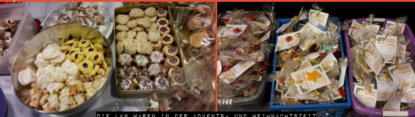
DIE LKG WAREN IN DER ADVENTS- UND WEIHNACHTSZEIT