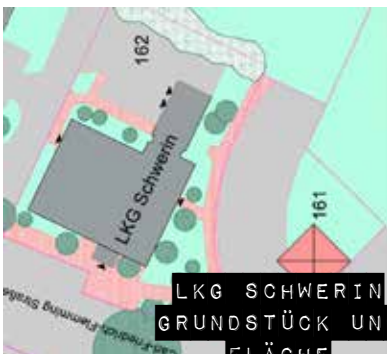
LKG SCHWERIN GRUNDSTÜCK UND FLÄCHE

Was Gemeindegründung im MGV bedeutet, wie sie sich vollziehen kann, wie die Zusammenarbeit mit Netzwerkpartnern gestaltet werden kann und andere Fragen, werden von einer Arbeitsgruppe erarbeitet und in einem Leitfaden „Gemeindegründung“ zusammengestellt.